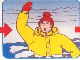
Не паниковать, позвать на помощь