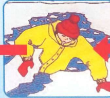
Забросить на лёд ногу, откатиться от полыньи